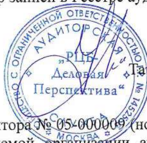
Татьяна Григорьевна Гринько

Квалификационный аттестат аудитора № 05-000009 (нового образца), выдан на основании Решения № 21 саморегулируемой организации аудиторов Некоммерческого партнерства «Российская Коллегия аудиторов» от 14.10.2011 г., на неограниченный срок.